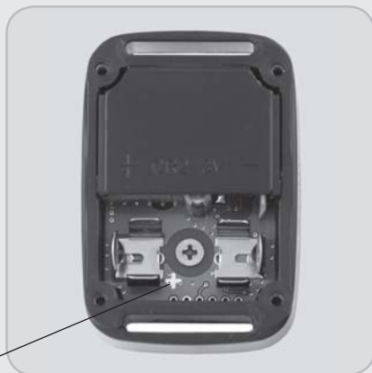
Označení polarity baterie